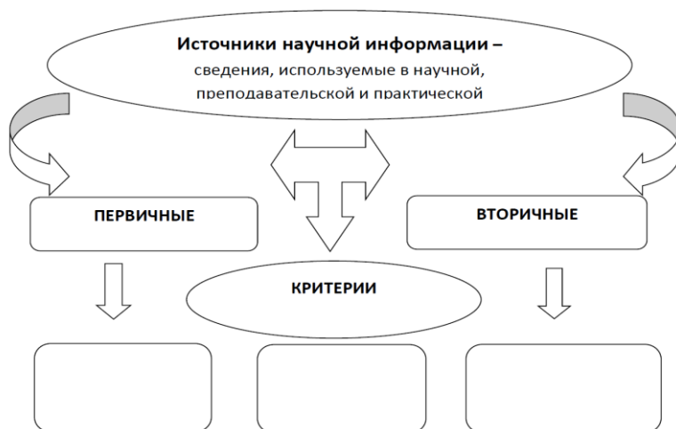
Схема. Источники научной информации

Задание 1.2. Прочитайте дополнительные материалы. Выберите автореферат диссертации по теме, близкой вам и оцените актуальность темы, отразив результаты анализа в таблице.