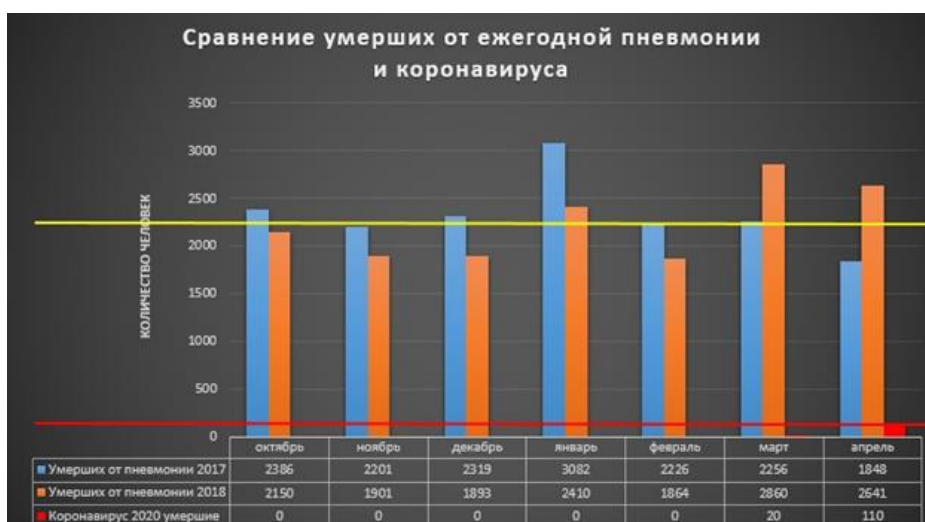
График 2. Сравнение количества умерших от пневмонии 2017-2018 годы и коронавируса. (Умершие по данным Росстата)

Жёлтым- среднее значение за два сезона 2017-2018 годов