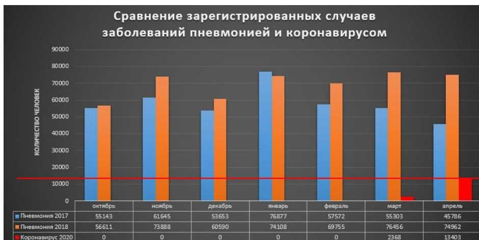
График 1. Сравнение зарегистрированных случаев заболеваний пневмонией и коронавирусом (пневмония по данным Роспотребнадзора за 2017-2018 годы).

Учёные пользуются различными методами для достижения определённых целей. На графиках представлены сравнительные данные зарегистрированных случаев заболеваний пневмонией и коронавирусом и смертностью от них.